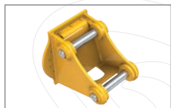
Platine de montage